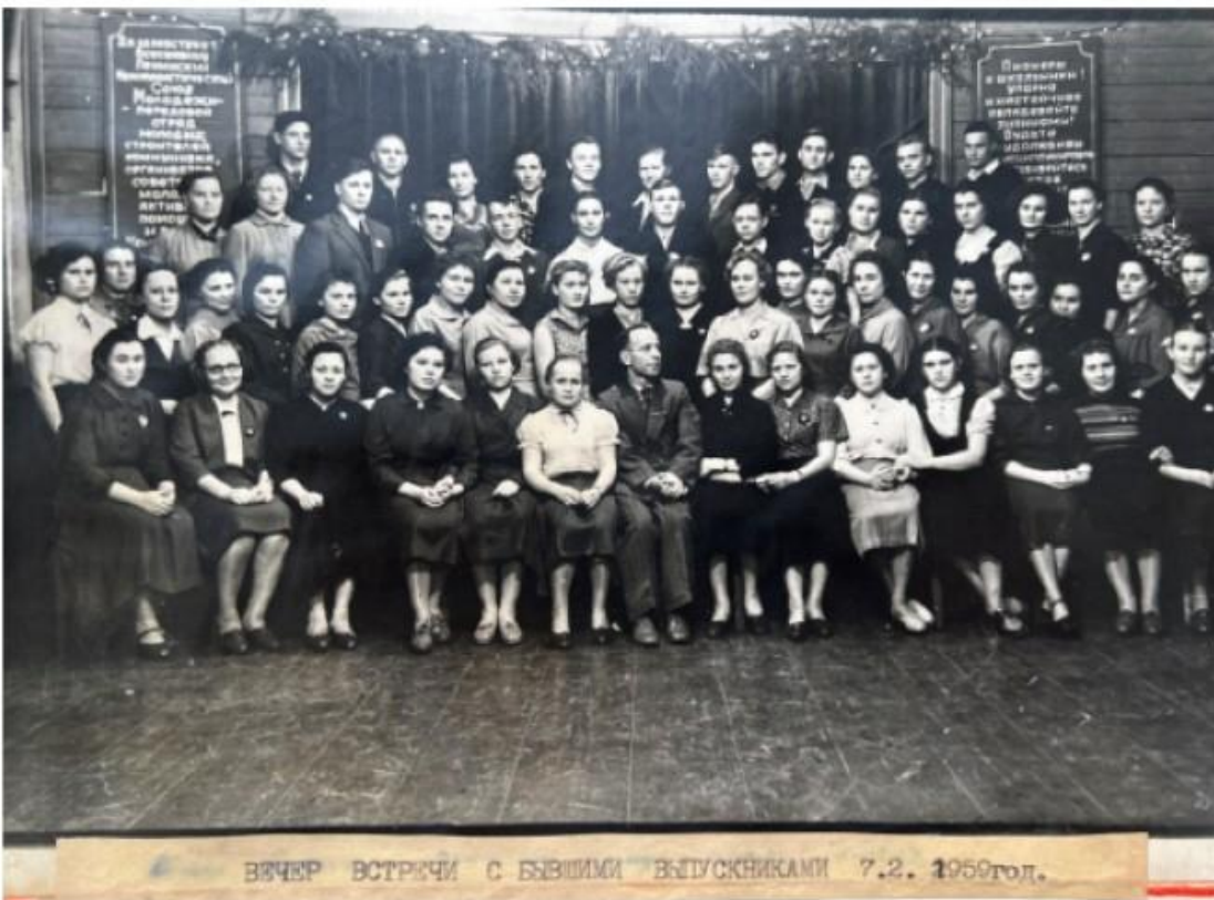
ВЕЧЕР ВСТРЕЧИ С БЫВШИМИ ВЫПУСКНИКАМИ 7.2. 1959 год.