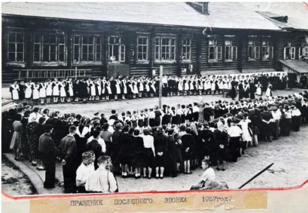
ПРАЗДНИК ПОСЛЕДНЕГО ЗВОНКА 1957 год.